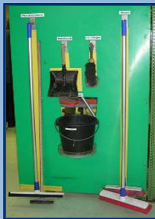
Nachher: Jedes Ding hat seinen festen Platz!