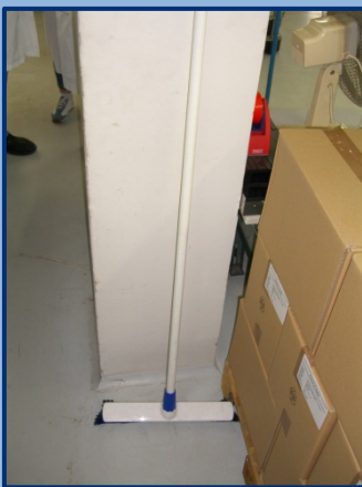
Vorher: Suche nach Werkzeug

Wer kennt das Problem nicht: Während der Arbeit suchen wir immer wieder Werkzeuge oder Hilfsmittel. Anhand sogenannter „Shadow boards“ (dt. Schattenbretter) lässt sich sehr schnell und einfach Ordnung schaffen und aufrecht erhalten. Jederzeit ist erkennbar, ob etwas fehlt oder ob etwas Überflüssiges vorhanden ist!